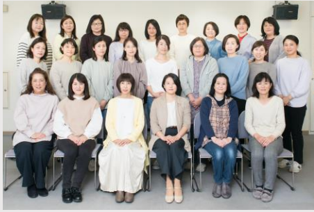
代表理事（最前列左から3人目）